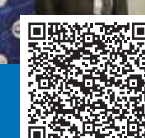
Оборудование Госпиталю ветеранов войн

Санкт-Петербургское региональное отделение Союза машиностроителей России ко Дню Великой Победы