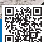
Фотовыставка «Профессии Победы»