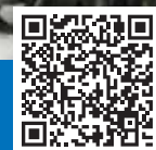
218 Авиационный ремонтный завод