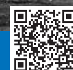
Кировский завод и танки Победы Ж.Я. Котина