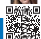
«Всё остается людям»