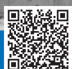
Средне-Невский судостроительный завод