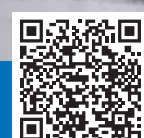
Судостроительный завод «Северная верфь»