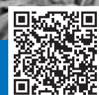
«Интелтех» – «Красная Заря»